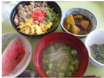
来食サービスは、60歳以上の方であれば登録すれば利用できます。職員も食べられます。

みのわのカラーは、空と海の青(ブルー)となっています。ロゴマークにとまっているのは、幸せの青い鳥となっています。