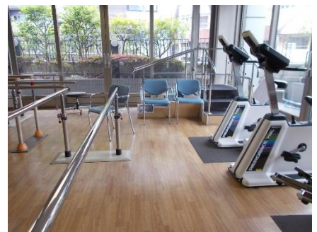
運動プログラム中心のコースです。昼食も提供しています。

みのわデイでは、平成30年度の介護保険制度改正にともない、4月から新たに4時間滞在型の運動プログラム中心の通所介護のコースを開始しました。